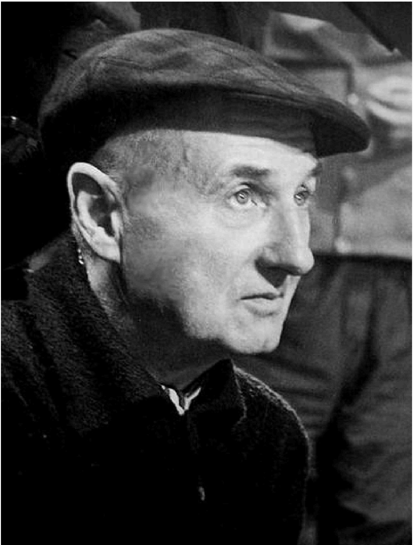
Claude Autant-Lara, de La traversée de Paris aux bancs du FN.

Pour autant, il existe une contre-culture d'extrême droite , dépassant le national, présente parmi les plus radicaux. Celle-ci est marquée par le futurisme (version italienne et fasciste), par les «avancées conservatrices» (comprendre la «révolution conservatrice» allemande des années 1920), le rock (eh oui!), notamment la scène «boneheads» (les skins d'extrême droite) ou le NSBM (le «national-socialist black metal»). Il ne faut pas prendre ces contre-cultures pour des marges négligeables, au contraire. Si ces milieux restent marginaux, ils vendent bien, notamment le dernier, fort à la mode aujourd'hui. Le NSBM permet la formation et la conscientisation politiques, amenant, par leurs